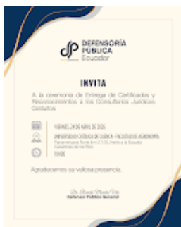
invitación evento.png 252K