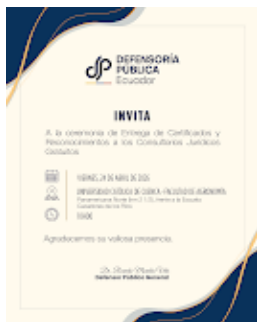
invitación evento.png 252K