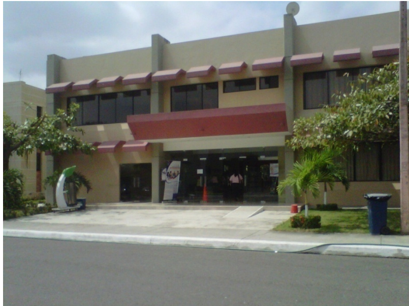
Foto No. 1. Foto de la Fachada principal de la Biblioteca Dr. Paúl Ponce Rivadeneira /Archivo Dirección de Obras universitarias.

La Universidad Estatal de Milagro inicio sus actividades en el año 1969, funcionando como extensión de la Universidad Estatal de Guayaquil, en ese tiempo no tenia infraestructura propia, brindando a los estudiantes universitarios la atención bibliotecaria en las instalaciones del Colegio Fiscal José María Velasco Ibarra, la misma, contaba con pocos libros con las especializaciones de ese entonces: Físico Matemático, Químico Biólogo, Literatura y Castellano, Filosofía, Historia y Geografía.