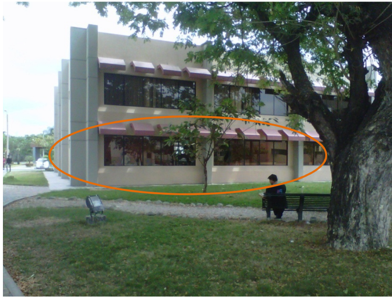
Foto No. 2. Fachada posterior de la Biblioteca Dr. Paúl Ponce Rivadeneira.

departamentales, esto se dio en el año 2009, dándose inicio a la construcción de un edificio de 2 plantas, en la cual funcionan la Biblioteca General (planta baja), el Vicerrectorado Académico y Administrativo y el departamento de Organización y Desarrollo Integral (planta alta) de la UNEMI. La construcción que fue entregada al servicio de la comunidad estudiantil en el año 2010.