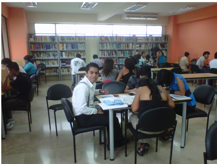
Foto No. 4. Estudiantes en el área de lectura de la Biblioteca Dr. Paúl Ponce Rivadeneira.

Como se puede observar en el cuadro, el estudiantado de la Universidad Estatal de Milagro (UNEMI) ha crecido, teniendo un promedio en los últimos 5 años de 5.500 estudiantes matriculados.