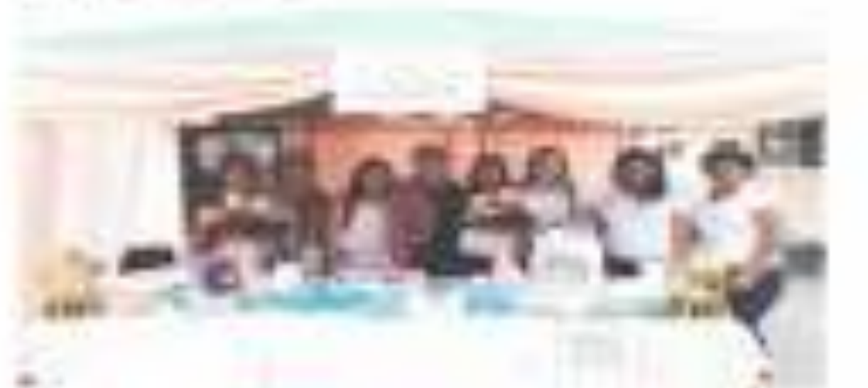
El equipo de docentes, técnicos e investigadores del Instituto Tecnológico Fomento del Emprendimiento de la Universidad Estatal de Milagro en el marco de la feria de emprendimiento de la ciudad de Milagro.