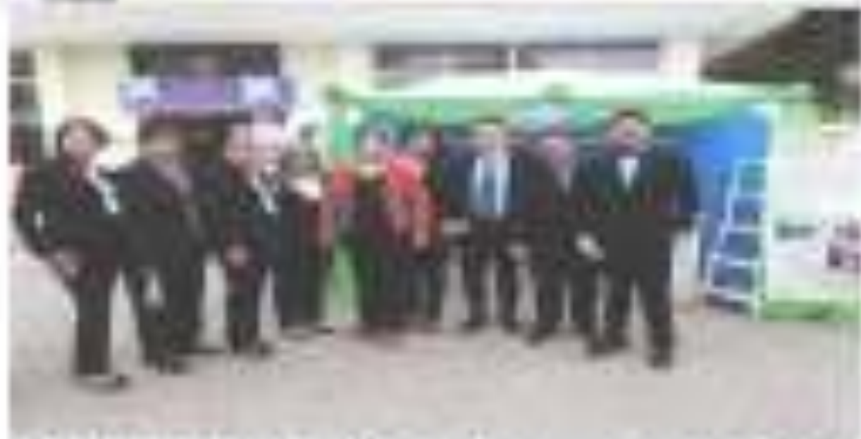
El equipo de docentes, técnicos e investigadores del Instituto Tecnológico Fomento del Emprendimiento de la Universidad Estatal de Milagro en el marco de la feria de emprendimiento de la ciudad de Milagro.