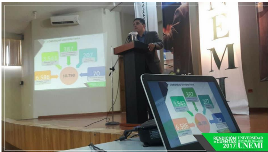
RENDICIÓN DE CUENTAS 2017 UNIVERSIDAD ESTATAL DE MILAGRO UNEMI