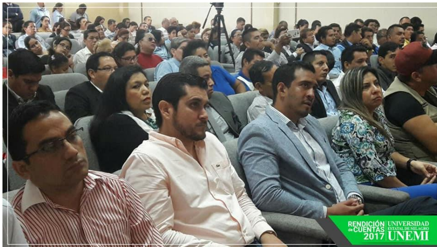
RENDICIÓN DE CUENTAS 2017 UNIVERSIDAD ESTATAL DE MILAGRO UNEMI