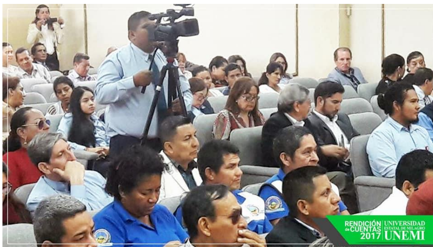
RENDICIÓN DE CUENTAS 2017 UNIVERSIDAD ESTATAL DE MILAGRO UNEMI

Dirección: Cda. Universitaria Km. 1 1/2 vía Km. 26 Conmutador: (04) 2715081 - 2715079 Telefax: (04) 2715187 • E-mail: rectorado@unemi.edu.ec Milagro • Guayas • Ecuador